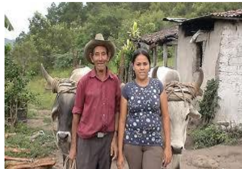
Capacitación productiva a Familias de escasos recursos